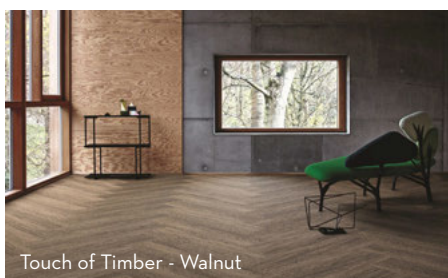
Touch of Timber - Walnut

Touch of Timber är ett textiltävlingsgolv som påminner om trä medan Twist & Shine erbjuder en unik design. Båda kollektionerna består av 100 % återvunnet nylongarn och innehåller också formaldehydfri glasfiberduk. Kollektionerna har ett Cool Carpet certifikat som kompenserar för de utsläpp som inte kan elimineras.