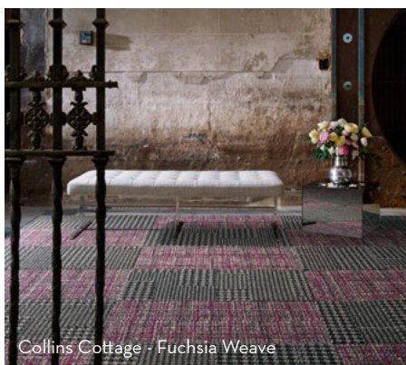
Collins Cottage - Fuchsia Weave

Den nya mattkollektionen World Woven är formgiven exklusivt för Interface av den brittiska designern David Oakey. Kollektionen präglas av det okomplicerade, handgjorda och icke-perfekta – uttryck som efterfrågas alltmer av inredare också för offentliga miljöer.